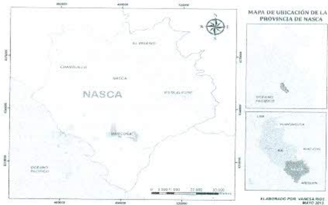
Mapa de Localización de la Provincia de Nasca.

El distrito de Nasca es la capital de la provincia del mismo nombre, cuenta con una población de 27,011 habitantes.